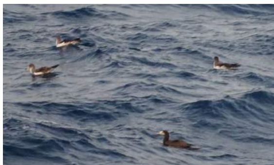
Fou brun Sula leucogaster (dossier 18/77), Sidi Ifni, 28/08/2018 (Sandra Villar)

Première homologuée par la CHM. Ce Fou brun adulte a été photographié au milieu d'un radeau de Puffins cendrés à 50 km au large de Sidi Ifni (29°31.30' N 10°43.37' W). Le Fou brun est un visiteur accidentel sur la côte atlantique marocaine : les précédentes données comprennent 2 immatures à Qualidia le 14/09/1979, des adultes à Essaouira en mai 1985, à Salé le 8/11/1987 et à l'embouchure de l'oued Massa le 5/01/1987 et le 9/01/1992 (Thévenot et al. 2003). Les non nicheurs se dispersent largement vers le nord dans l'Atlantique Est puisqu'il y a des données jusqu'aux Açores et en Espagne (Carboneras et al. 2020).