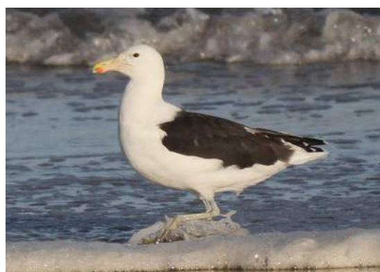
Goéland dominicain Larus dominicanus (dossier 18/83), Akhfennir, 31/10/2018 (Benoît Maire)

23° à 25° données approuvées par la CHM pour ce Goéland qu'on retrouve dans des zones du Sahara Atlantique traditionnellement fréquentées, en particulier la région d'Akhfennir / Khnifiss et celle de Dakhla.