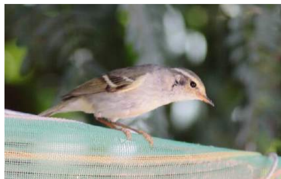
Pouillot à grands sourcils Phylloscopus inornatus (dossier 19/14), Mijk, 22/02/2019 (Gérard Kenter)

A noter qu'un individu a été capturé au baguage le 13 avril 2019 par Marc Illa et son équipe à l'Auberge Yasmina près de Merzouga (observation non encore soumise à l'homologation) ; cet individu présentait un léger indice d'adiposité, qui pourrait suggérer qu'il venait peut-être d'effectuer un long vol migratoire transsaharien ( http://www.go-south.org/14-april-2019-a-yellow-browed-warbler-at-yasmina/ ).