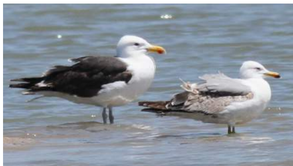
Goéland marin x Goéland dominicain Larus marinus x Larus dominicanus (dossier 19/29), Oualidia, 24/04/2019 (Benoît Maire)

que fréquente également le Goéland dominicain depuis au moins 2009.