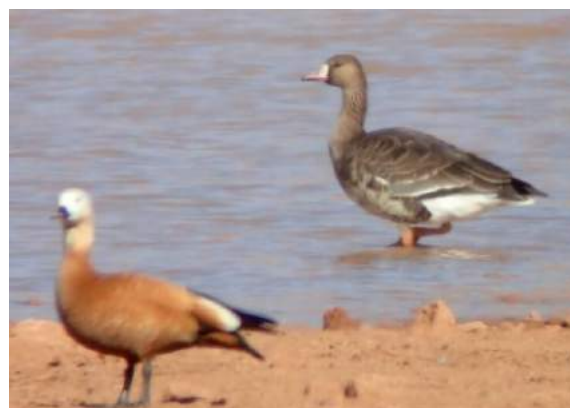
Oie rieuse Anser albifrons (dossier 19/3), Barrage Cherg Bouarfa, 17/01/2019 (Geoffrey Monchaux)

Onzième donnée nationale et cinquième homologuée par la CHM. Donnée hivernale dans une région encore jamais visitée par cette espèce accidentelle au Maroc.