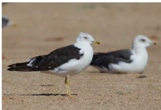
Goéland de la Baltique Larus fuscus fuscus (dossier 18/106), Mhiriz, 02/11/2018 (E. Durand)

Sixième donnée validée par la CHM. Un oiseau en plumage adulte a été photographié à Mhiriz le 2 novembre 2018 et présentait toutes les caractéristiques de la sous-espèce fuscus dont la plupart des représentants hivernent normalement en Afrique de l'Est. La présence du Goéland de la Baltique a été authentifiée par le contrôle à Dakhla le 24 février 2017 d'un oiseau bagué en Suède (Fernandes 2017 in Go-South.org).