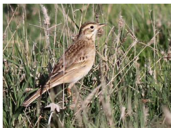
Pipit de Richard Anthus richardi (dossier 18/87), Dar Bouazza, 15/12/2018 (Benoît Maire)

Vingt-deuxième et vingt-troisième données homologuées par la CHM. Deux données cette année pour ce Pipit sibérien hivernant en petit nombre sur les côtes atlantiques marocaines. L'observation de quatre oiseaux à Dar Bouazza est très intéressante, en nombre et en qualité, puisqu'elle révèle un nouveau site d'hivernage probable sur cette zone humide menacée de disparition par la promotion immobilière.