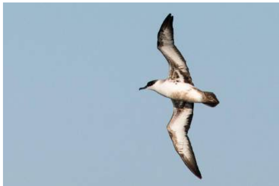
Puffin majeur Ardenna gravis (dossier 18/69), Agadir, 29/10/2018 (Arnaud B. van den Berg)

Quatorzième donnée homologuée. Observé quasi annuellement depuis 2011 en fin octobre / début novembre au large d'Agadir lors de la migration pré-nuptiale vers ses sites de nidification dans les îles de l'Atlantique Sud.