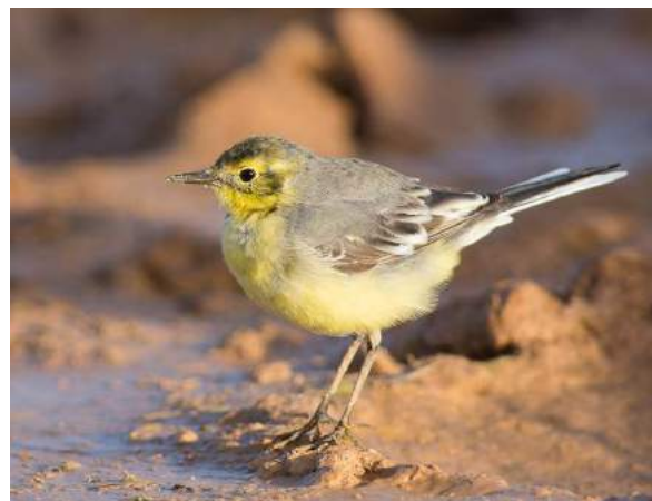
Bergeronnette citrine Motacilla citreola (dossier 19/7), route de Bir Anzarane, 25/02/2019

Huitième donnée nationale. La plupart des observations marocaines hivernales connues de cette bergeronnette asiatique accidentelle proviennent du nord du pays (surtout du Rharb). Cette donnée est donc étonnante par la latitude ; elle représente seulement la seconde pour le Sahara Atlantique marocain (Bergier et al. 2019).