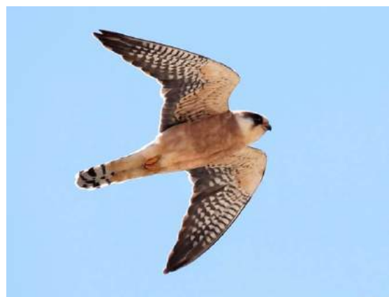
Faucon kobez Falco vespertinus (dossier 19/24), Melilla, 17/05/2019 (Cristobal Rosado)

Les observations de Faucon kobez au Maroc ont été détaillées par Bergier et al. (2015). Il y avait 29 mentions à fin 2014, dont cinq obtenues lors de la migration postnuptiale (dates extrêmes 22 août – 10 octobre), les autres au printemps (dates extrêmes 17 mars – 10 juin, pic d'avril à mi-mai).