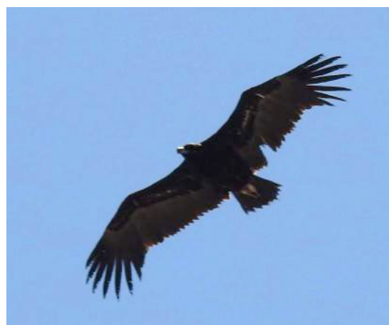
Vautour moine Aegypius monachus (dossier 19/23), Melilla, 07/05/2019 (Diego Jerez Abad)

Cette espèce qui niche dans le centre et le sud-ouest de l'Espagne avec une population dépassant 2000 couples (Andevski 2017), semble passer de plus en plus fréquemment au Maroc où il ne niche plus depuis le début du 20 ème siècle.