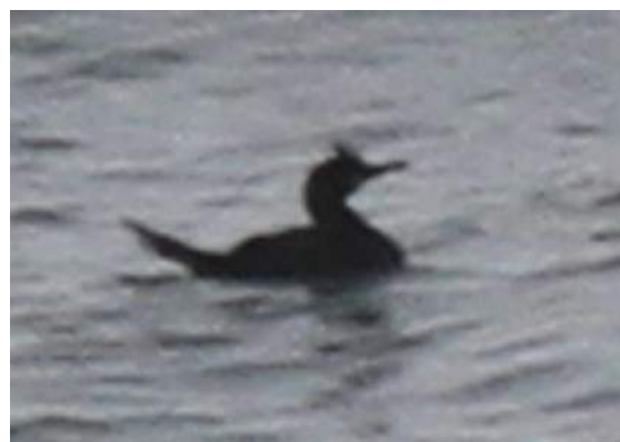
Cormoran huppé Phalacrocorax aristotelis (dossier 19/28), Tamri, 18/02/2019 (Benoît Maire)

Observation classique au niveau du dernier bastion de la sous-espèce endémique riggerbachi , en fort déclin. Oiseau adulte avec une huppe particulièrement développée pour cette sous-espèce.