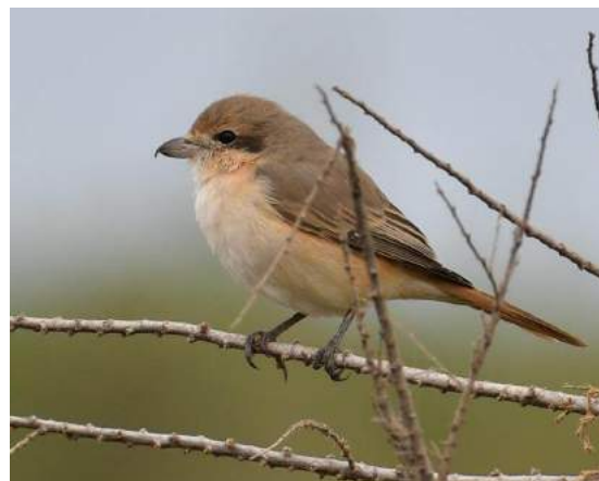
Pie-grièche isabelle Lanius isabellinus (dossier 19/2), Tamri, 18/02/2029