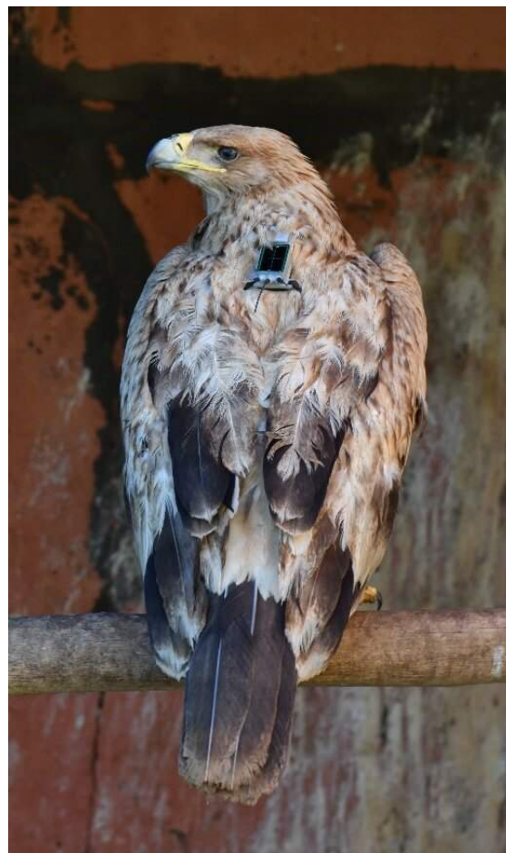
Aigle ibérique Aquila adalberti (dossier 18/80), Bouznika, 17/11/2018

Dix-huitième donnée approuvée par la CHM. L'Aigle ibérique se reproduisait autrefois en Afrique du Nord où il est maintenant éteint en tant que nicheur. Sa répartition est limitée à la Péninsule Ibérique, avec environ 577 couples nicheurs (Garcia Gonzalez & Rafael Garrido 2019), et où il fait l'objet d'actions de réintroduction. Les juvéniles et immatures se dispersent et sont de plus en plus souvent observés au Maroc, en passage au niveau du Déroit de Gibraltar, mais aussi dans d'autres régions plus méridionales. Il faut noter qu'il est nécessaire de veiller à fournir de bons documents photographiques pour différencier les jeunes Aigles ibériques des Aigles ravisseurs, en particulier pour les observations dans le sud du Maroc.