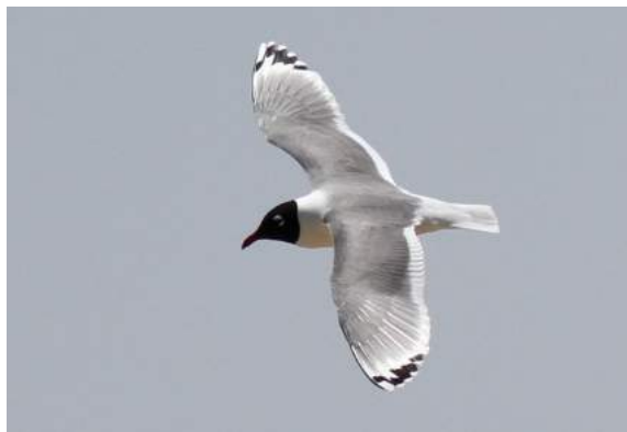
Mouette de Franklin Leucophaeus pipixcan (dossier 19/31), Merzouga, 22/04/2019

seule mention de cette espèce à l'intérieur des terres. Découverte par Marc Illa, Ivan Maggini et Georg Gruber le 8 avril 2019, elle est restée au même endroit au moins jusqu'au 23 avril.