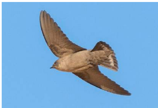
Hirondelle du désert Ptyonoprogne fuligula (dossier 19/10), Laglat, 27/01/2017 (Yeray Seminario)

Pouillot à grands sourcils – Yellow-browed Warbler Phylloscopus inornatus AV (1/1, 17/20, 6/6)