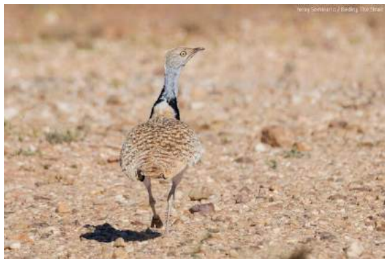
Outarde houbara Chlamydotis undulata (dossier 19/11), Graret Ouchfegt, 18/01/2019

L'Outarde houbara était auparavant commune dans tout le Sahara Atlantique (Valverde 1957). Elle y est très rare aujourd'hui et on ne connaît que deux observations récentes dans l'intérieur des terres : un oiseau au nord-ouest d'Aousserd le 16 janvier 2011 (X. Rufroy in Bergier et al. 2016) et trois oiseaux entre Boulariah et Oum Rouaguène le 8 décembre 2013 (G. Smith in Bergier et al. 2014).