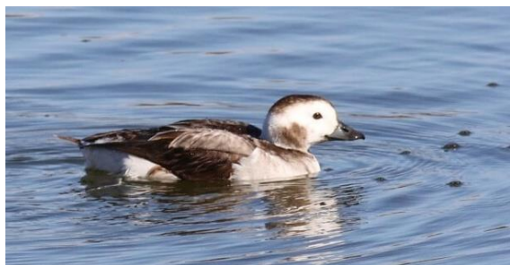
Harelde boréale Clangula hyemalis (dossier 15/98 ter), Essaouira, le 4 janvier 2016

Deuxième donnée nationale après celle réalisée en juin 2014 à Oualidia (Bergier et al. 2015) pour cette espèce boréale exceptionnelle sous nos latitudes.