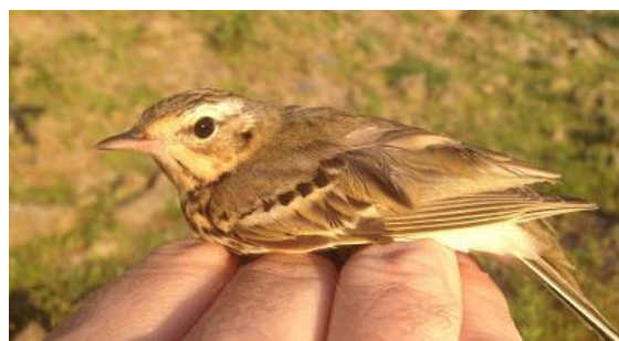
Pipit à dos olive Anthus hodgsoni (dossier 16/34), Ceuta, le 15 avril 2016 (Manuel Rodríguez Ríos)

Moineau doré – Golden Sparrow Passer luteus AV (0/0, 7/51+, 1/1)