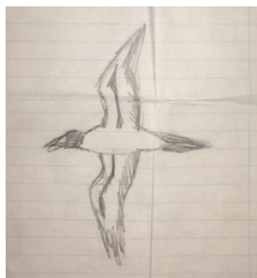
Fou masqué Sula dactylatra (dossier 97/32), Cap Rhir, le 13 janvier 1997 (Magnus Elfwing et Martin Stervander)