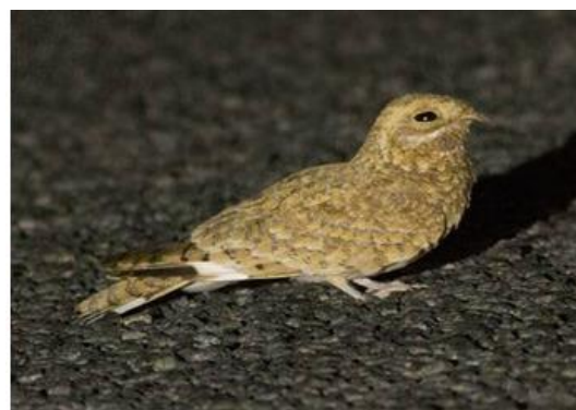
Engoulevent doré Caprimulgus eximius (dossier 16/49), Oued Jenna, le 21 avril 2016 (Jurrien van Deijk)

Deuxième à quatrième données. Après une première observation le 3 mai 2015 (Dyczkowski 2016), l'espèce a été recherchée avec succès sur la route d'Aousserd, en particulier à l'Oued Jenna où elle a pu être détectée, enregistrée et photographiée. Il pourrait s'agir d'une population nicheuse, la seule connue à ce jour pour le Paléarctique Occidental.