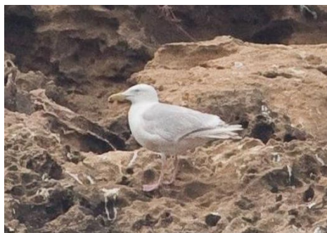
Goéland bourgmestre Larus hyperboreus (dossier 16/11), Essaouira, le 05 mai 2016 (Aleix Comas et al. )

discontinuer depuis janvier 2014 dans le port d'Essaouira et qui a atteint sa quatrième année calendaire.