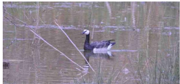
Bernache nonnette Branta leucopsis (dossier 15/100), Massa, le 6 décembre 2015

Troisième donnée nationale et première homologuée par la CHM depuis sa création. Un oiseau a été vu à l'estuaire de l'oued Ksob à Essaouira le 4 décembre 1979 (Thévenot et al. 1981) et Bayton a noté deux oiseaux au même endroit le 3 novembre 1987 (Thévenot et al. 2003).