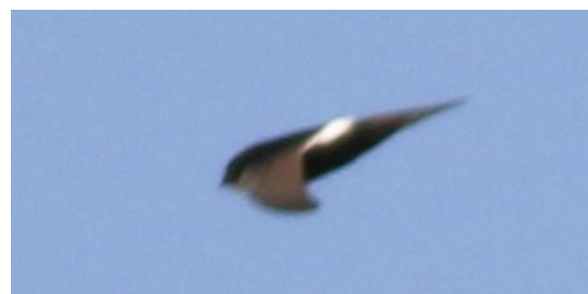
Martinet cafre Apus caffer (dossier 15/113), Imlil, le 12 juillet 2015

Douzième donnée nationale homologuée par la CHM, sur un site classique pour l'espèce.