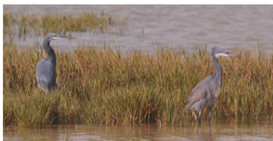
Aigrette des récifs Egretta gularis (dossier 16/05), Dakhla, le 24 janvier 2016 (Franck Chevalier)