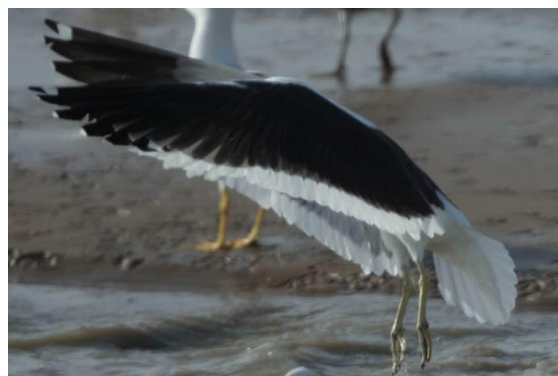
Goéland dominicain Larus dominicanus (dossier 16/06), Agadir, le 15 janvier 2016

Treizième et quatorzième données nationales.