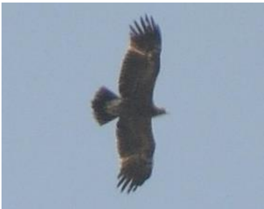
Aigle pomarin Clanga pomarina (dossier 16/46), Jbel Moussa, le 21 mai 2016 (Rachid El Khamlichi)

Aigle criard x Aigle pomarin – Greater x Lesser Spotted Eagle Clanga clanga x pomarina AV (0/0, 0/0, 1/1)