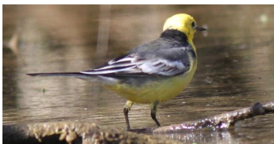
Bergeronnette citrine Motacilla citreola (dossier 16/17), Larache, le 11 mars 2016 (Benoît Maire)

Sixième donnée nationale, cinquième homologuée par la CHM. L'espèce avait déjà été observée en 2015 dans ces marais à des dates proches (Fareh et al. 2016).