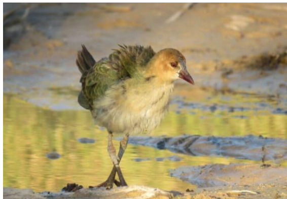
Talève d'Allen Porphyrio alleni (dossier 16/12), Gleib Jédiane, le 18/02/2016 (Mohamed Mediani)

Onzième donnée nationale pour cet afrotropical dont les juvéniles s'émancipent parfois vers le nord.