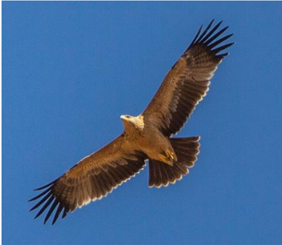
Aigle ibérique Aquila adalberti (dossier 15/87), Guelmim, le 7 novembre 2015 (Ali Irizi)