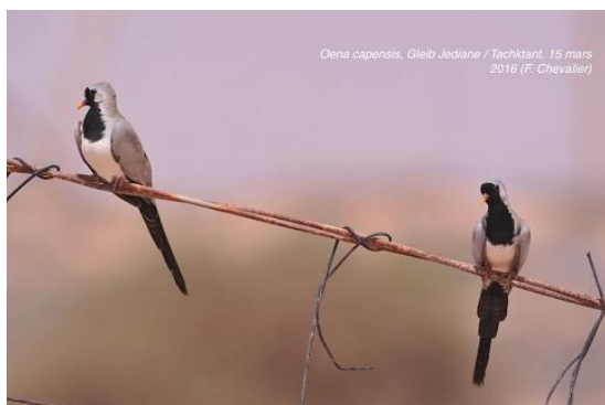
Tourterelle masquée Oena capensis (dossier 16/18), Gleib Jediane, le 15 mars 2016 (Franck Chevalier)

Septième à neuvième données nationales et quatrième à sixième homologuées par la CHM. Les observations ont été détaillées par Chevalier et al. (2016).