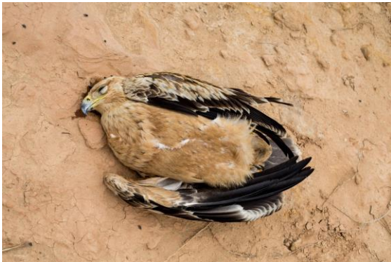
Aigle ibérique Aquila adalberti (dossier 15/97), Guelmim, le 22 octobre 2015

Busard pâle – Pallid Harrier Circus macrourus PM (24/30+, 14/14, 3/3)