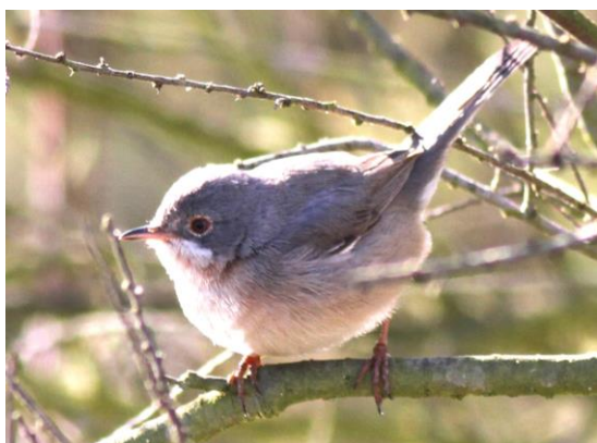
Fauvette de Moltoni Sylvia subalpina (dossier 16/52), Larache, le 11 mars 2016

Traquet isabelle – Isabelline Wheatear Oenanthe isabellina PM, OW?, OB? (54/90, 1/1)