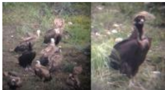
Vautour moine Aegypius monachus (dossier 16/43), Jbel Moussa, le 7 mai 2016 (Rachid El Khamlichi)

Dix-huitième à vingt-deuxième données marocaines et cinquième à neuvième homologuées par la CHM : uniquement des données printanières d'oiseaux de retour d'Afrique, et uniquement au niveau du Détroit de Gibraltar. Une très bonne année pour cette espèce qui semble passer de plus en plus fréquemment au Maroc. Jusque là, seules quatre observations avaient été homologuées par la CHM, dont trois depuis 2012. La donnée du 17 mars 2016 concernant quatre oiseaux arrivant du Maroc sur la rive espagnole du détroit est exceptionnelle : c'est la première fois qu'on enregistrerait un tel nombre de Vautours moines en un seul jour de migration printanière.