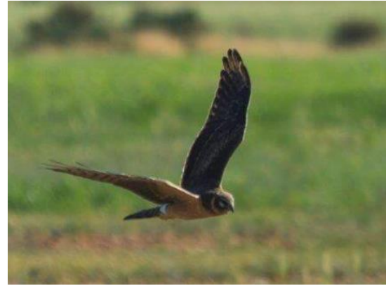
Busard pâle Circus macrourus (dossier 16/02), Guelmim, le 13 janvier 2016 (Juan Miguel González)

Trente-neuvième à quarante-et-unième données nationales. Cette espèce devient de plus en plus régulière. Toutes les données homologuées par la CHM jusqu'à nos jours ont eu lieu en période de migration printanière. À noter la grande précocité de ce passage prénuptial.