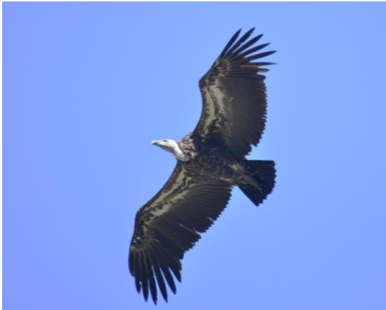
Vautour de Rüppell Gyps rueppelli (dossier 16/40), Jbel Moussa, le 2 mai 2016 (Rachid El Khamlichi)

Seizième à vingt-quatrième données nationales. Sur ces 24 données (en grande majorité printanières et réalisées au niveau du Déroit de Gibraltar), 17 ont été obtenues depuis 2014, ce qui traduit une nette augmentation des passages entre l'Afrique et l'Espagne. Paradoxalement, le statut de conservation global de cette espèce est très préoccupant : le Vautour de Rüppell fait partie des quatre espèces de vautours africains désormais classés par l'UICN en danger critique d'extinction.