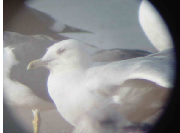
Larus glaucooides – Aghroud, 11 janvier 2004 (H. Dufourny et al. )